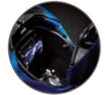
Maletero de 22 lts.